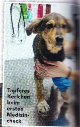
Tapferes Kerlchen beim ersten Medizincheck