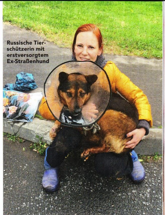
Russische Tierschützerin mit erstversorgtem Ex-Straßenhund

Der Mut und die Bemühungen der engagierten Hunderetter reichen nicht aus, um eine tierfreundliche Lösung zu finden. Eine Zusammenarbeit mit dem Staat ist dringend notwendig. Auch wenn die Mühlen der Behörden langsam mahlen und Inkompetenz, mangelnder Wille und Korruption ihr Übriges tun. Immerhin fordern Vertreter der Bürgerinteressen wie „Anton Tsvetkov, Mitglied der Gesellschaftlichen Kammer der Russischen Föderation, dass Russland ein eigenes Gremium zur Einbeziehung von veri-