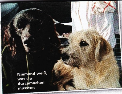
Niemand weiß, was sie durchmachen müssten

selten werden Welpen und Kätzchen von Kindern zum Fußballspielen benutzt.“ Mit einer Strafe müssen Tierquäler nicht rechnen. In Russland gibt es kein Tierschutzgesetz, sondern nur einen Gesetzesentwurf über den verantwortungsvollen Umgang mit Tieren. Dieser wurde 2011 in der Staatsduma (dem Unterhaus) verabschiedet. Seine Annahme wird jedoch immer wieder verschoben. Somit sind Vierbeiner rechtlos, und auch die auf dem Land „arbeitenden“ Hunde mit Halter führen kein besseres Leben als ihre Artgenossen in der Stadt. Sie werden als Hof-, Wach- oder Herdenschutzhund eingesetzt und am Rande des Existenzminimums gehalten. „Die Landbevölkerung besitzt meist selbst nicht viel“, sagt Seipold. „Es gibt kein Geld für die vernünftige Versorgung eines Hundes oder für die Kastration. Die Hunde vermehren sich willkürlich.